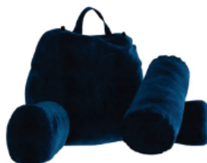
▼ Almohadón respaldo con apoyabrazos