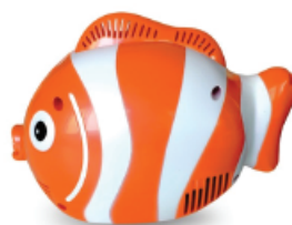
Nebulizador a pistón