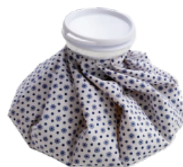
▼ Bolsa de hielo