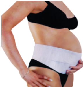
Cinturón pre parto