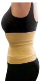
Faja de acrílico regulable de 24cm