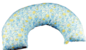
▼ Almohadón para amamantar