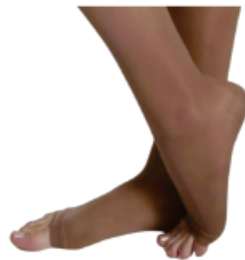
▼ Medias de Compresión Corta sin puntera