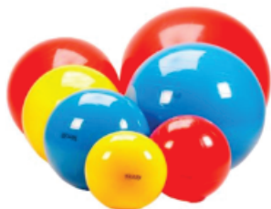
▼ Pelota de esferodinamia. Medidas: 55 a 85 cm