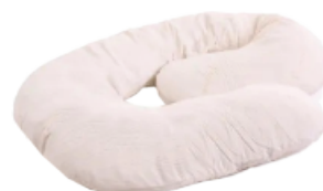
▼ Almohadón (THERABODY)