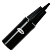
▼ Inflador para pelotas de esferodinamia

Ideales para aliviar el dolor de espalda, mejorar la postura, fortalecer los músculos pélvicos y abdominales, mejorando la preparación para el parto. Además, contribuyen a relajar el cuerpo y reducir el estrés.