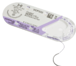
VICRYL Plus Antibacterial