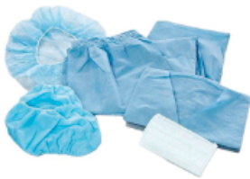
Kit de Partos con Ambo (Estéril)