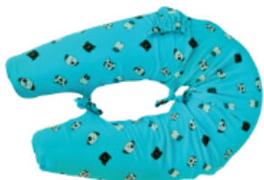
▼ Almohadón para amamantar

Los almohadones ergonómicos facilitan el descanso en el embarazo y la lactancia en posición tumbada, evitando contracturas y molestias. Reducen las molestias en cuellos, espaldas y brazos al amamantar. Contamos con distintos modelos que se adaptan a las necesidades de cada mamá y bebé.