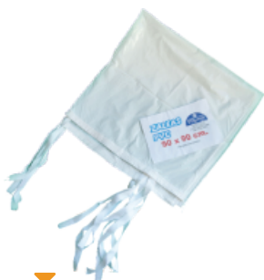
▼ Zalea de PVC