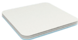
▼ Zalea Tela Lavable