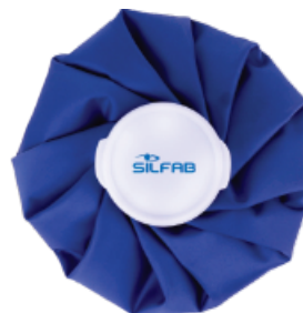
▼ Bolsa para hielo y agua caliente.