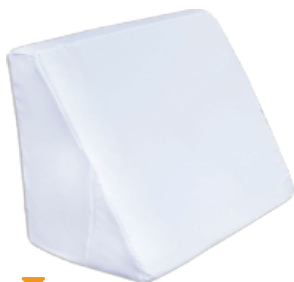
▼ Respaldo triangular de 50x37