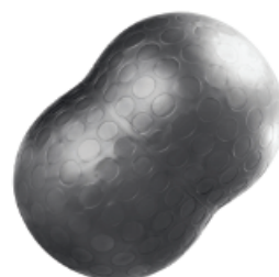
▼ Pelota inflable esferodinamia maní