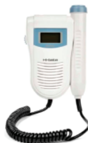
Detector De Latidos Fetales Doppler

El detector Hi bebe es un ultrasonido fetal Doppler de bolsillo para detectar los latidos del corazón del feto desde la semana 10. Es fácil de usar y con gran calidad de sonido.