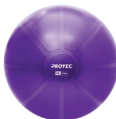
▼ Pelota de esferodinamia reforzada