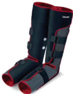
Botas De Presoterapia Para Masajes

Estas botas realizan un masaje por presión de aire revitalizando, liberando tensiones y aliviando las piernas cansadas. Reducen la retención de líquidos, pesadez y el dolor. Además, ayudan a prevenir várices y celulitis.