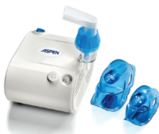
Nebulizador a pistón