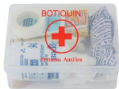
Botiquín de primeros auxilios